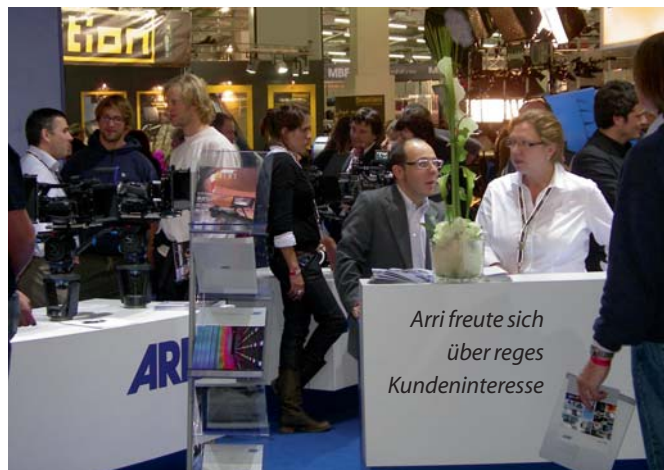
Arri freute sich über reges Kundeninteresse

auch bei den Einreichungen zum Preis niederschlugen. Insbesondere die Entwicklungen im Ausleuchtungsbereich hat die Jury mit Auszeichnungen für gleich drei LED-Produkte (Bebop GmbH/Cineparts, Roscolab, Arri) heraus-